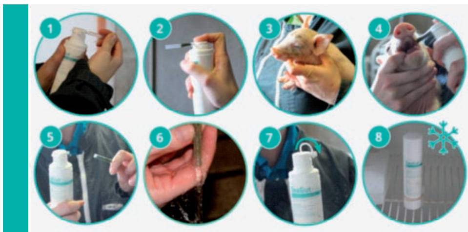
VPE: praktische 100ml-Airless-Tube

Die Anwendung von SeaGut® Paste erfolgt unmittelbar bei Sichtbarwerden von Verdauungsstörungen über 1-2 Tage mit jeweils 2ml je Tier. Olmix SeaGut® PASTE für eine bessere Darmgesundheit von Ferkeln – einfach in der Anwendung.